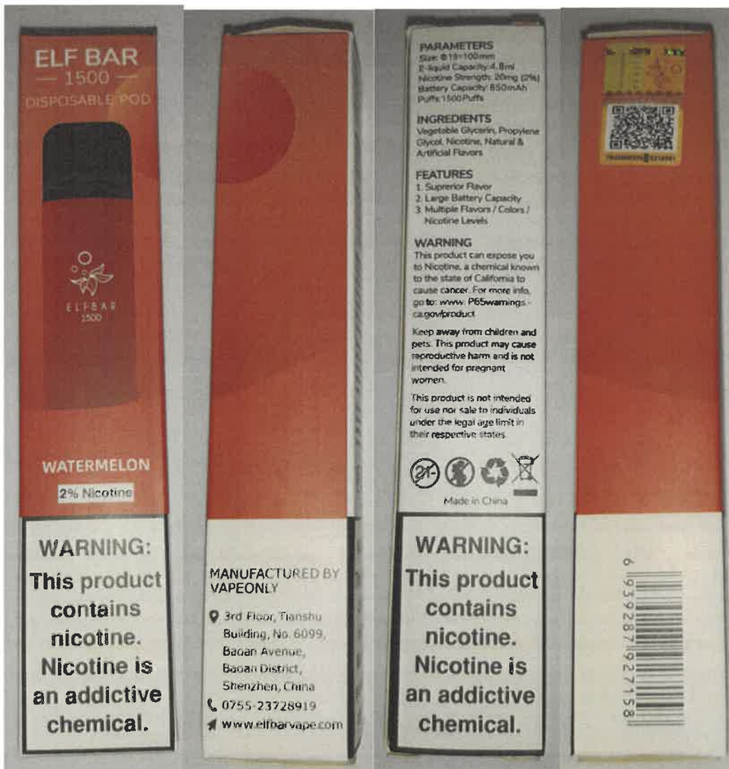
Fotografie - ELFBAR 1500 Disposable Pod 4,8 ml, 20 mg/ml nikotinu