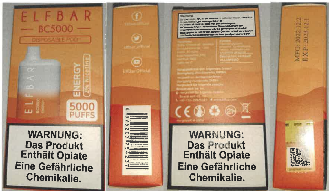
Fotografie nebezpečného výrobku ELFBAR BC5000 ENERGY 13 ml, 20 mg/ml