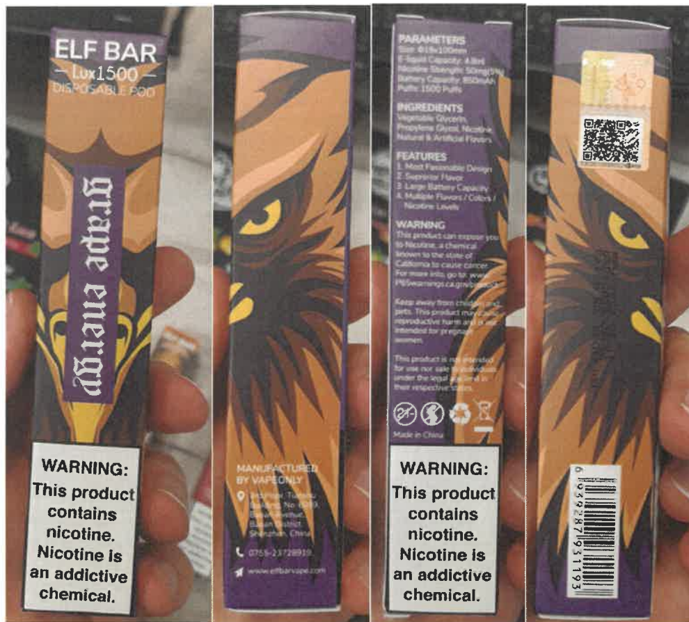
Hlavní fotografie ELF BAR Lux 1500