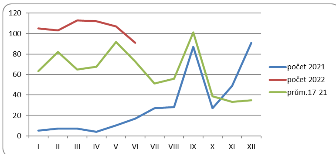
Graf 1: Výskyt onemocnění virovou gastroenteritidou v ZK v letech 2021, 2022 v porovnání s 5letým průměrem