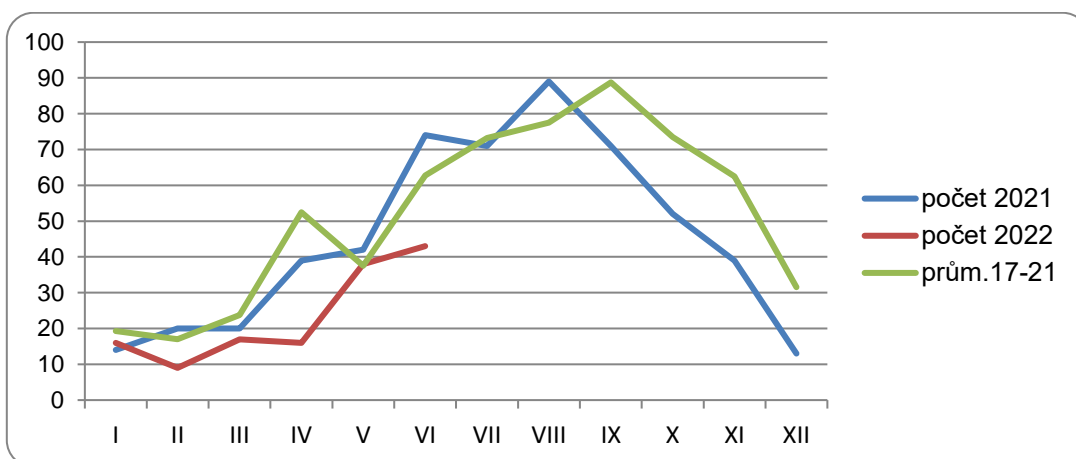
Graf č. 2: Výskyt salmonelózy v ZK v letech 2021, 2022 v porovnání s 5letým průměrem