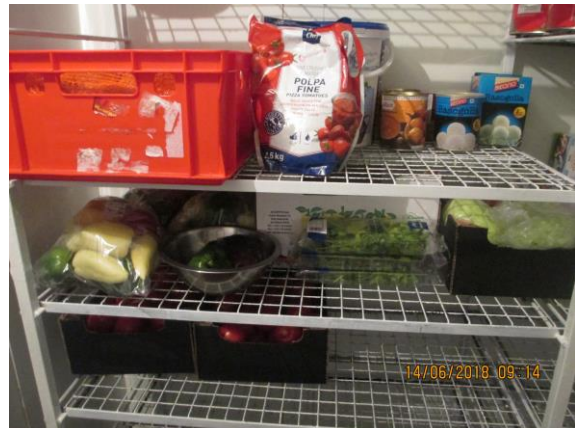
správné uložení potravin dle slučitelnosti a kovový rošt po natření