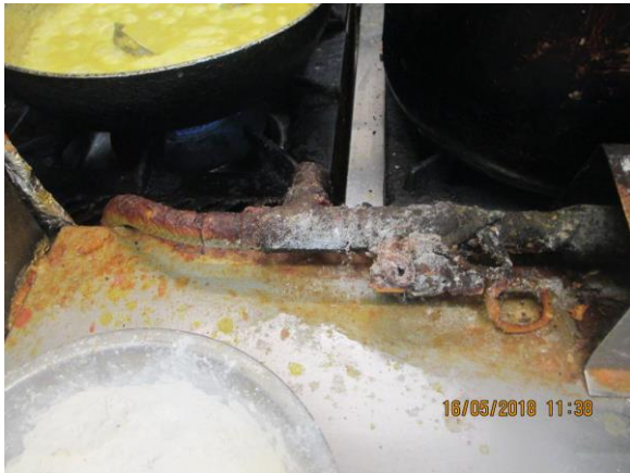
znečištěné povrchy sporáku v kuchyni