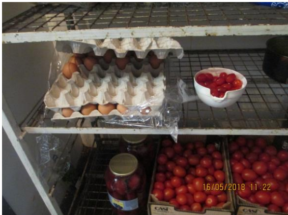
nevhodné uložení potravin v chladicím boxu a zrezivělý kovový rošt