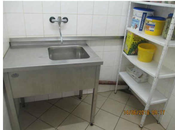
zprovozněná hrubá přípravná zeleniny