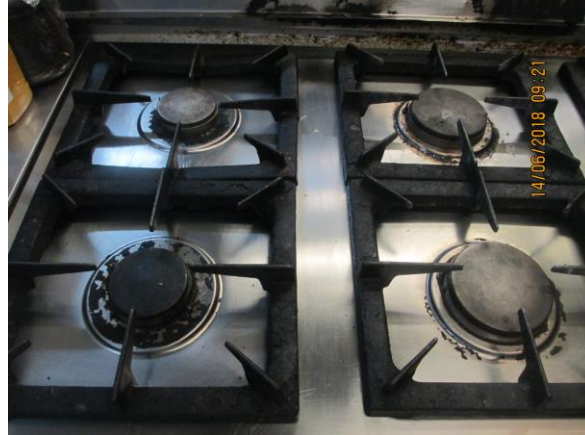
sporák po vyčištění