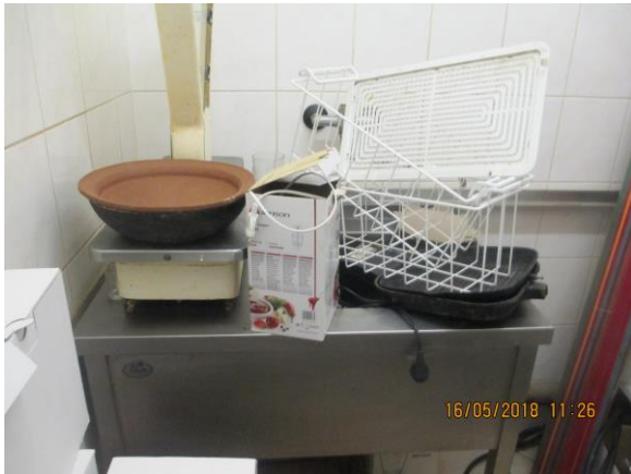
nevyžívaná hrubá přípravná zeleniny

Tel. 577 006 737, e-mail: khs@khszlin.cz, podatelna@khszlin.cz, ID: xwsai7r