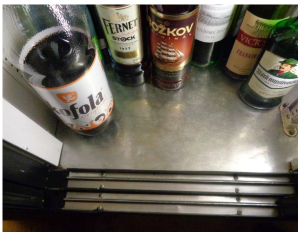
Chladicí zařízení - vyčištěno