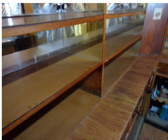
Barové zápultí - uklizeno