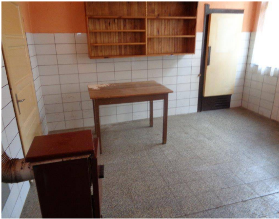
Osobní věci a inventář - odstraněny