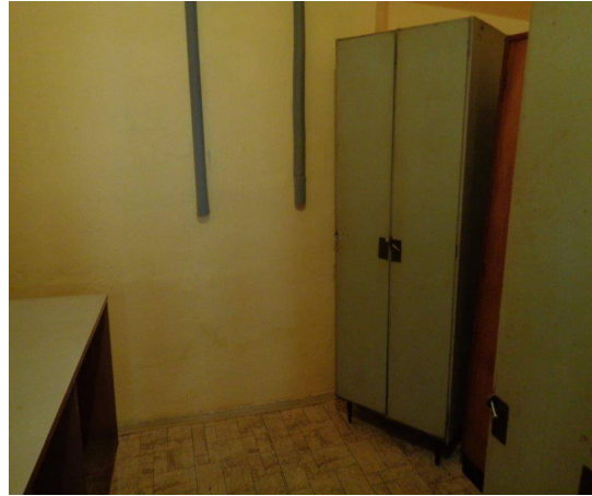
Šatna – vymalována a uklizena