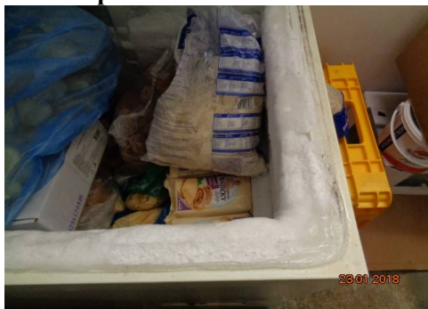
mrazicí pult s námrazou