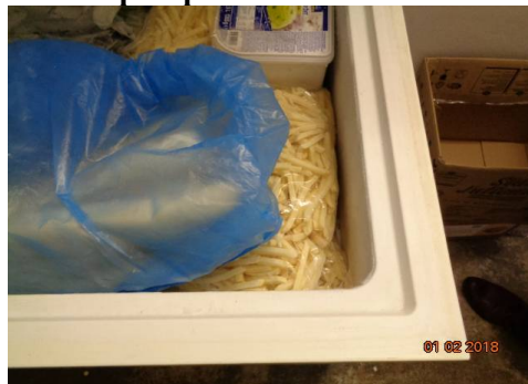
mrazicí pult po odmražení