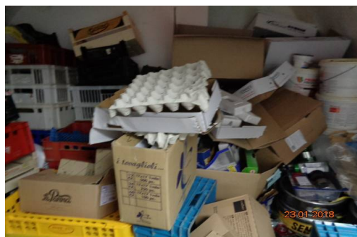
sklad potravin s komunálním odpadem