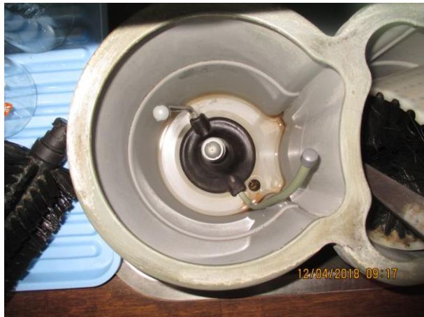
Spüllboy při opakované kontrole: