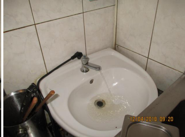
Umyvadlo na ruce při opakované kontrole: