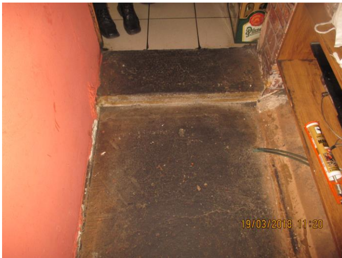
Neudržovaná podlaha ve spojovací chodbě: