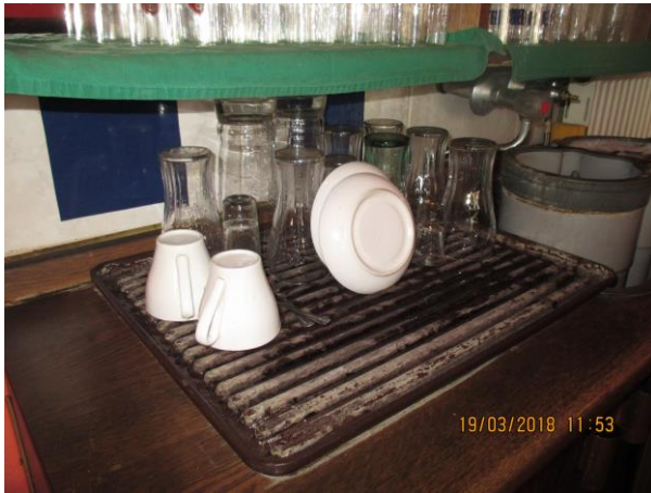
Znečištěná odkapávací plocha na nádobí: