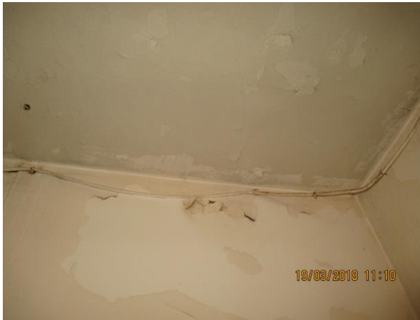
Olupující se malba a znečištění stěn a stropu: