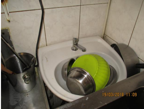
Nepoužívané umyvadlo na ruce bez tekoucí vody: