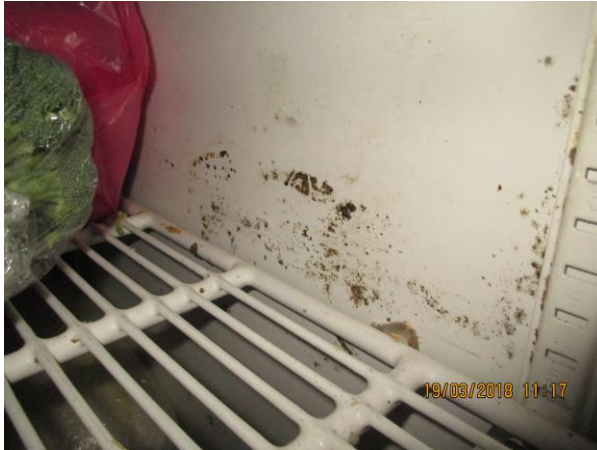
Nečistota uvnitř chladicího zařízení: